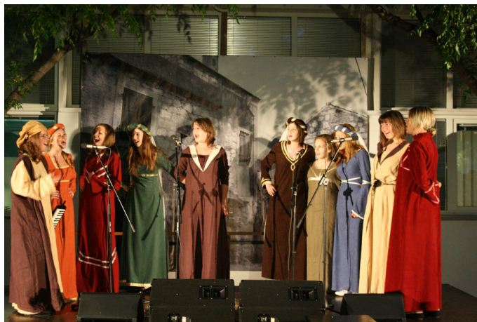
Slika 3 – Prvi festival dječjih klapa u Gradskoj knjižnici Zadar, 29. svibnja 2009.

Nakon tri smotre 2009. godine iskristalizirala se potreba za osnivanjem 1. festivala dječjih klapa u Hrvatskoj. [38] Cilj Festivala, kao nove folklorne pojave, nije profesionalizacija i natjecanje, nego očuvanje i prenošenje tradicije klapskog pjevanja i priprema djece i mladih za buduće klapske pjevače.