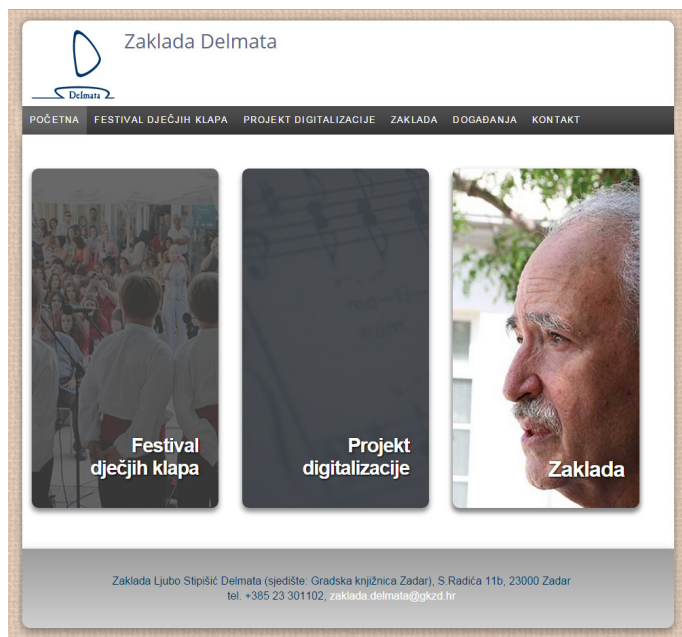
Slika 9 – Mrežna stranica

Od 2012. godine Gradska knjižnica Zadar ima nove mrežne stranice. Od 2013. godine na jednome mjestu, radi lakšeg snalaženja, svi baštinski projekti Knjižnice ( Smotra i Festival dječjih klapa , Projekt digitalizacije Delmata , osnivanje Zaklade Ljubo Stipišić Delmata ) tematski su objedinjeni na mrežnim stranicama Zaklade Delmata : www.delmata.org .