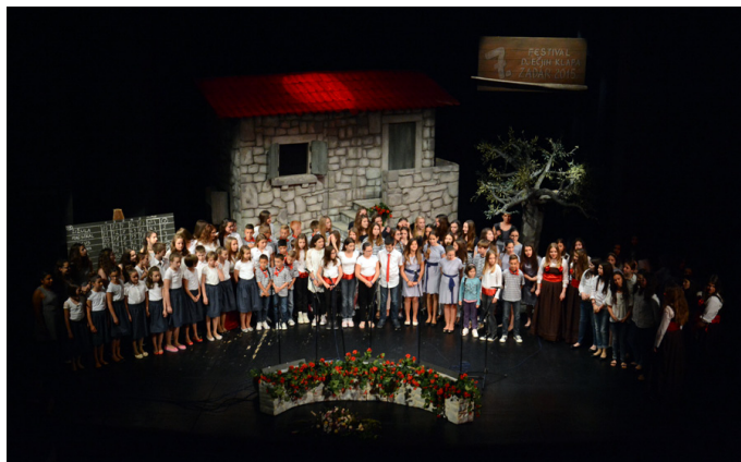
Slika 6 – Sedmi festival dječjih klapa, Hrvatsko narodno kazalište Zadar, 23. svibnja 2015.