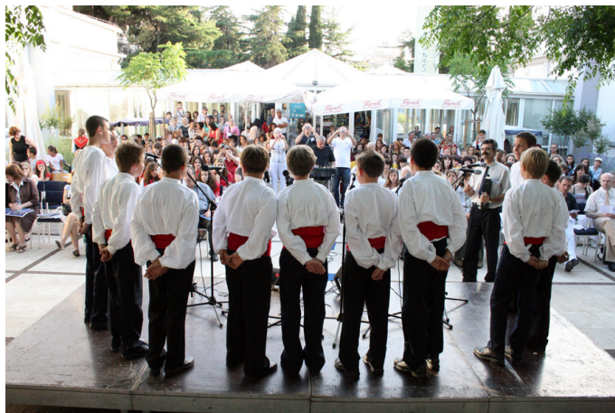
Slika 2 – Muška dječja klapa „Mrkinta” iz Vele Luke na otoku Korčuli na 3. smotri dječjih klapa u Gradskoj knjižnici Zadar, 30. svibnja 2008.