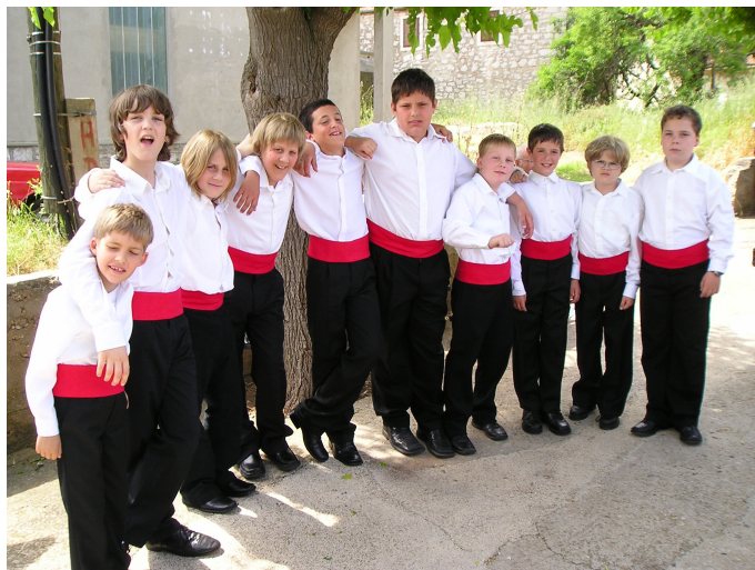
Slika 1 – „KoLibrići“, muška dječja klapa Gradske knjižnice Zadar, u Salima na Dugom otoku na Županijskoj smotri folklor, 19. svibnja 2006.

(Vranjic), [34] koji su pjevali božićne napjeve, rapski pjevači, koji su izvodili korizmeni oratorij Klapska muka (Rabska) [35] , te mnogi drugi.