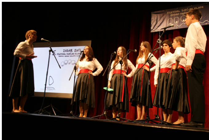
Slika 4 – Dječja klapa „Biokovski slavuji“ iz Zagvozda na 5. festivalu dječjih klapa u Hrvatskom narodnom kazalištu u Zadru, 24. svibnja 2013.

Sudionici su Festivala dječje klape iz raznih krajeva Hrvatske, od Rijeke, Zagreba, Krka, Raba, Zadra, Šibenika do Splita, Omiša, Korčule i Neuma (BiH). Osnivači i podupiratelji dječjih klapa mogu biti pojedinci ili razne institucije iz područja kulture i obrazovanja: osnovne i srednje škole, glazbene škole, kulturno–umjetnička društva, udruge, pučka učilišta, knjižnice i drugi.