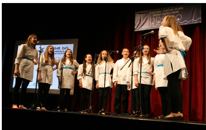
Slika 5 – Dječja klapa „Bersice“ iz Zadra na 5. festivalu dječjih klapa u Hrvatskom narodnom kazalištu u Zadru, 24. svibnja 2013.

Sudionici su Festivala dječje klape iz raznih krajeva Hrvatske, od Rijeke, Zagreba, Krka, Raba, Zadra, Šibenika do Splita, Omiša, Korčule i Neuma (BiH). Osnivači i podupiratelji dječjih klapa mogu biti pojedinci ili razne institucije iz područja kulture i obrazovanja: osnovne i srednje škole, glazbene škole, kulturno–umjetnička društva, udruge, pučka učilišta, knjižnice i drugi.